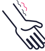
Slap gevoel in armen en benen