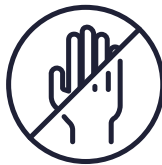
Geen gevoel in handen en voeten